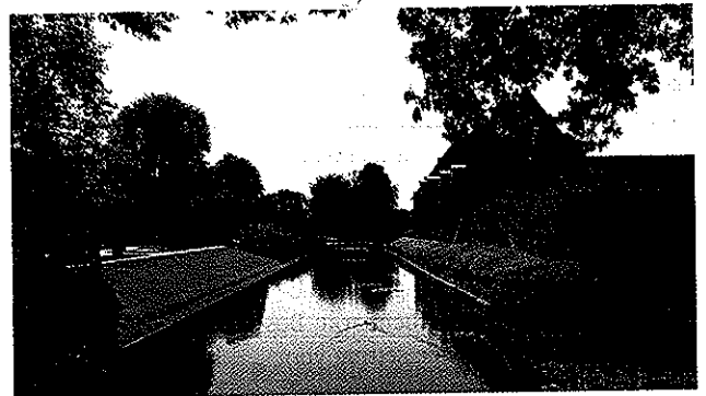
Het huis ligt strategisch, temidden van opborrelend kwelwater

Een ontwikkeling door de tijden heen wil niet zeggen dat er maar lukraak wat is gedaan