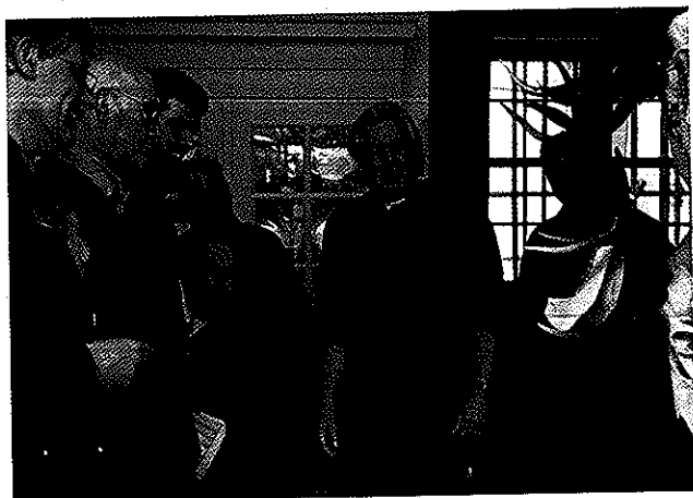
Geïnteresseerd publiek bij de tentoongestelde geweien in het kasteel

Deze potentie hebben landgoederen nog altijd. Onderhoud aan monumentale gebouwen en groene monumenten biedt veel werkgelegenheid en houdt ambachtelijke kennis in stand. Het zijn prachtige sociale werkplaatsen, waar zogenaamde 'zwakkeren' uit onze samenleving een werkplek in de luwte vinden. Juist landgoederen bieden goede aanknopingspunten om landschapselementen en natuur te behouden en te ontwikkelen. De essentie van een landgoed is dat de landschappelijke, cultuurhistorische, ecologische en economische waarden met elkaar in evenwicht zijn. Een zekere spanning tussen die waarden levert een mooi cultuurgood op, waar velen wel bij varen. Omwonenden voelen zich met 'hun' kasteel of 'hun' landgoed verbonden. Het zijn plekken die identiteit geven aan de leefomgeving. De vele vrijwilligers bewijzen de kracht van die uitstraling.