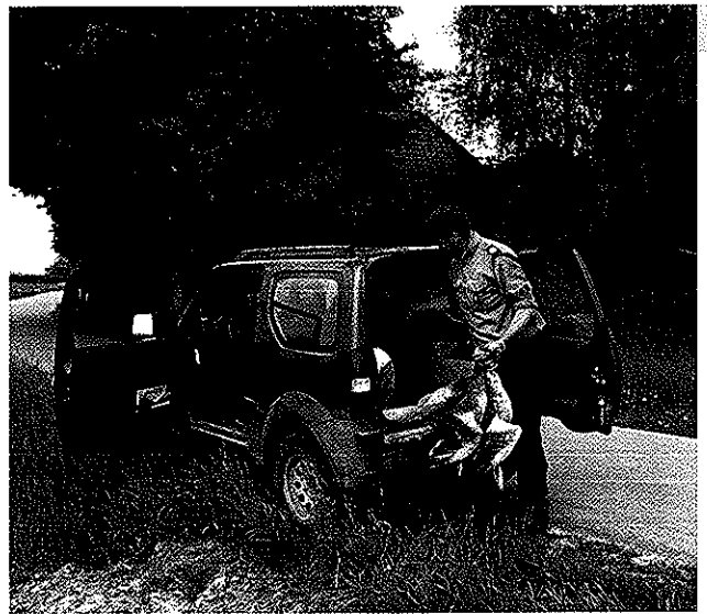
De jachttopzichter zorgt voor een gezonde wildstand. Geschoten wild wordt bijvoorbeeld door de poelier verwerkt tot overheerlijke paté

“Ik pleit ervoor om de maatschappelijke functie van landgoederen en buitenplaatsen een plek te geven in het monumentenbeleid”