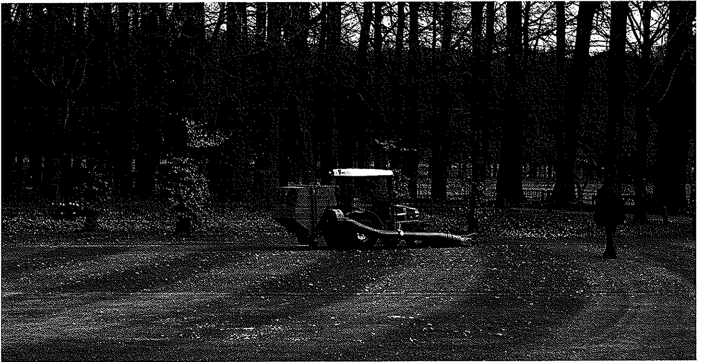
Onderhoud van de tuinen is veel werk en biedt volop werkgelegenheid

kennis voor de verzorging van kuipplanten, om die straks weer aan de volgende generatie tuinlieden door te geven. Veel van interieur en inboedel is nog aanwezig en wordt zelfs gebruikt. Er is een hondenkerkhof en voor Skippy, de hond van de gravin is al een plekje gereserveerd. Je kijkt weg via adembenemende zichtassen, langs boerenhagen die zijn samengesteld uit een variëteit aan (oude) heesters. Die struiken zijn een belangrijk biotoop voor braamsluipe, wezel en vlinders. Middachten is dus weliswaar compleet, maar ontwikkelt zich ook nog steeds en toont nieuwe schakeringen in de tijd.